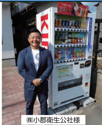
(株)小郡衛生公社様