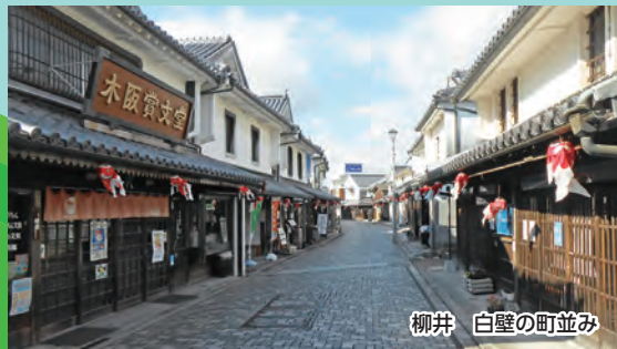
柳井 白壁の町並み