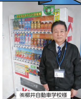
(株)柳井自動車学校様