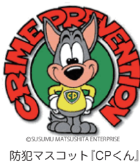
防犯マスコット「CPくん」