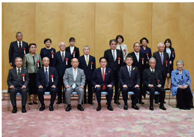
総理大臣官邸での記念撮影