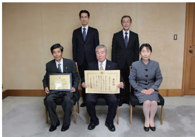
警察本部長への報告

◆「大殿地区安心のまちづくり委員会」は、平成13年の大阪教育大付属池田小学校事件をきっかけとして平成15年に設立。登下校時の児童見守り、青少年の防犯パトロール、うそ電話詐欺の被害防止に向けた広報活動、JR山口駅駐輪場の放置自転車撤去作業など多岐に渡る地道な活動が評価され今回の受賞に至り、令和3年10月15日に総理大臣官邸で岸田総理から直接受賞しました。