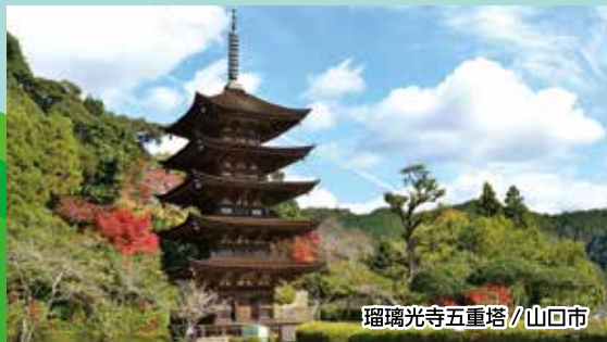
瑠璃光寺五重塔/山口市