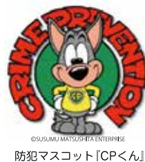
防犯マスコット「CPくん」