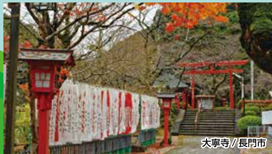
大寧寺 / 長門市