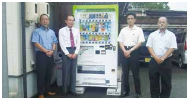
犯罪防止支援自動販売機